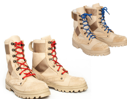
Ботинки с высокими берцами утеплённые бежевого цвета со шнурками красного (синего, бежевого) цвета