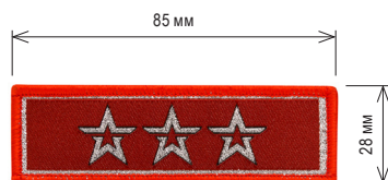
Нарукавный знак, определяющий принадлежность к ВВПОД «ЮНАРМИЯ»