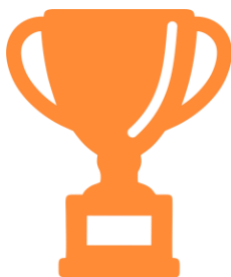
Логотип трека «Орлёнок – Спортсмен»

Ценности, значимые качества трека: здоровый образ жизни