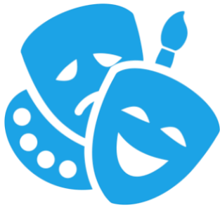
Логотип трека «Орлёнок – Мастер»