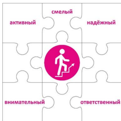
Конструктор «Лидер» 2 класс

Чтобы быть лидером, нужно много знать, уметь вести за собой, постоянно развиваться. Личность лидера многогранна, она словно складывается из множества разных пазлов, которые в целом дают яркую и интересную картинку. Конструктор «Лидер» представляет собой большой пазл, где центральный элемент – символ трека – человечек, поднимающийся вверх по лестнице. Остальные части этого пазла – элементы небольшого размера, примерно формата, на каждом из которых в левом верхнем углу написаны по одной букве из алфавита.