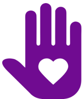
Логотип трека «Орлёнок – Доброволец»

Реализация трека проходит для ребят 1-х классов в начале декабря, но его тематика актуальна круглый год. Важно, как можно раньше познакомить обучающихся с понятиями «доброволец», «волонтёр», «волонтёрское движение». Рассказывая о тимуровском движении, в котором участвовали их бабушки и дедушки, показать преемственность традиций помощи и участия. В решении данных задач учителю поможет празднование в России 5 декабря Дня волонтёра.