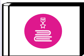
Альбом хранителя исторической памяти

Символ «альбом Хранителя» многозначен и достаточно ёмок в своём воплощении. Исходя из возможностей детского коллектива, уровня его сформированности и вовлеченности в коллективно-творческую деятельность, педагог вместе с детьми может придумать форму альбома Хранителя, где можно разместить историческую летопись класса, района, города и всей страны. Это могут быть переплетенные между собой чистые листы для рисунков, фотографий, открыток, объединённые общей тематикой и историей.