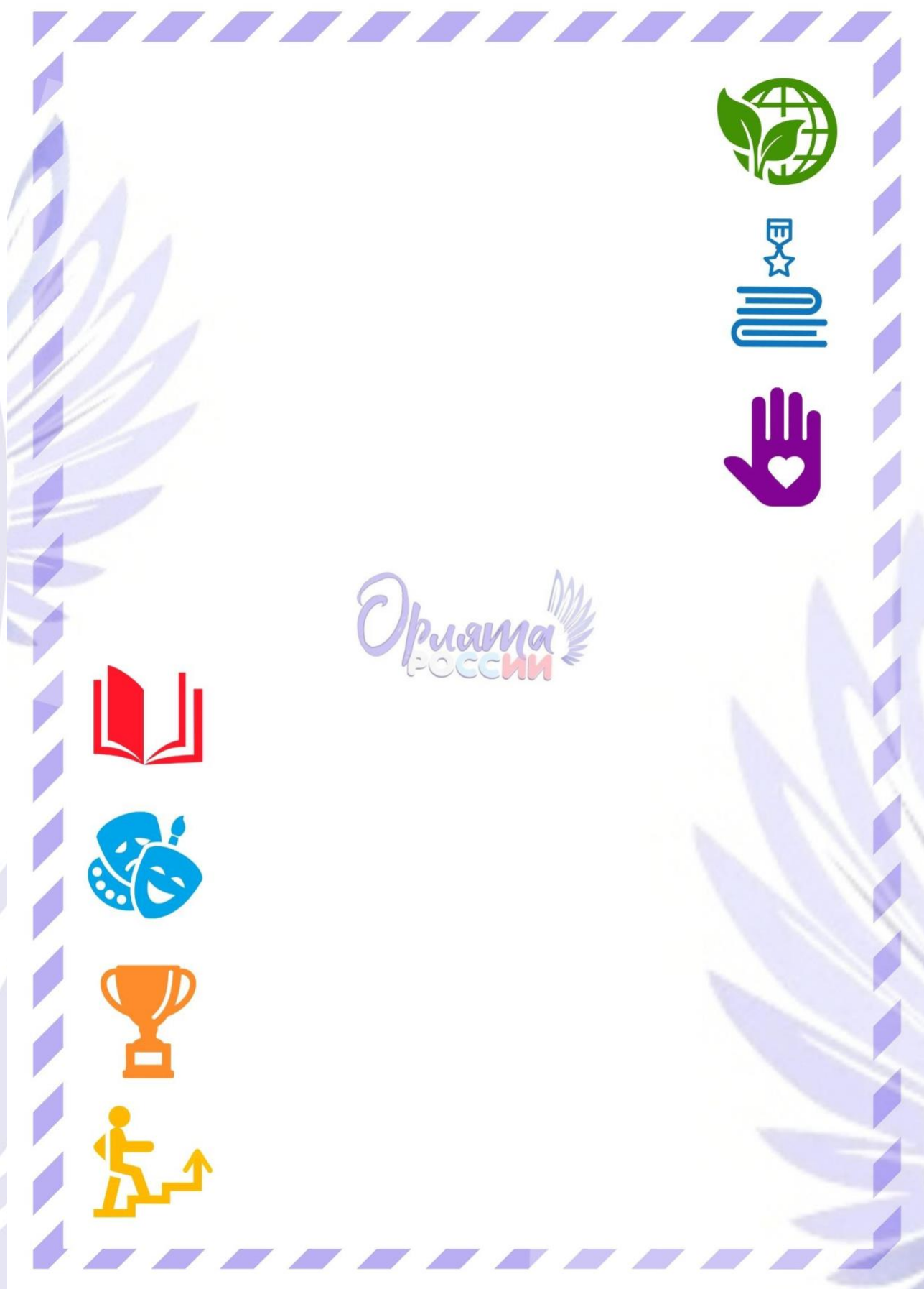
Рис. 2. Обратная сторона «Письма в Будущее».