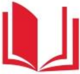
Логотип трека «Орлёнок – Эрудит»